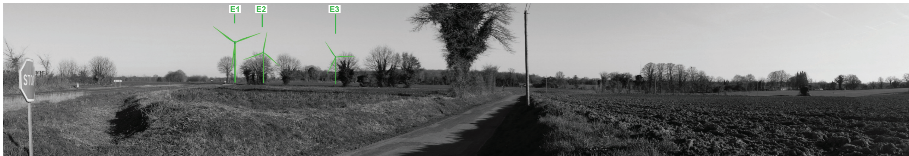
Vue panoramique noir et blanc avec esquisse du projet (angle de vue 120°)

Coordonnées Lambert II étendu : 412992 / 2140542,2 Date et heure de la prise de vue : 14/02/2019 à 18:14 Focale : 52 mm, équivalent 24 x 36 Azimut vue réaliste : 102° Angle visuel du parc : 13,3° Eolienne la plus proche : E1, à 1 152 m