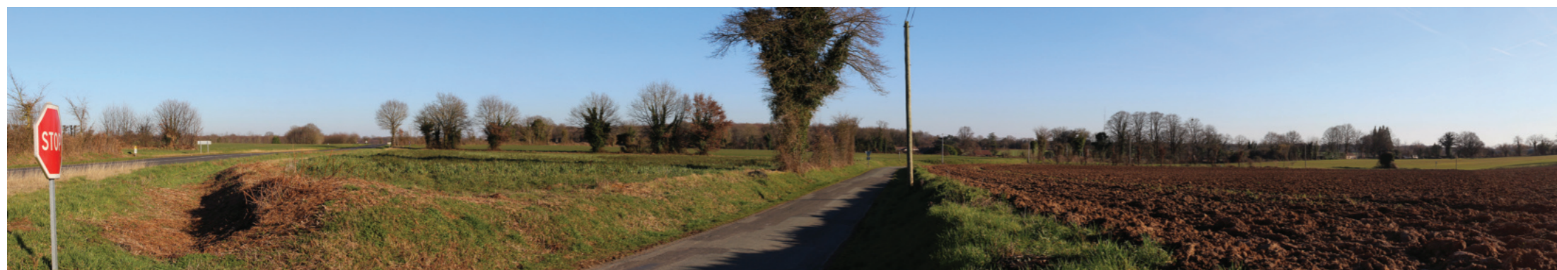
Vue panoramique de l'état initial (angle de vue 120°)